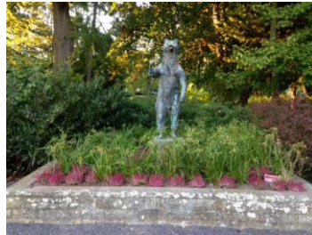
Berliner Bär am Parkbad