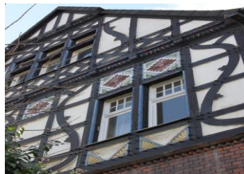
Villa Mentrup Lütkeweg